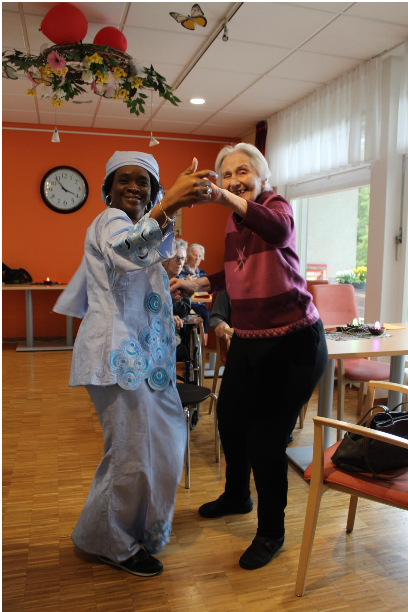
« les résidents se sont envolés au rythme envoûtant des djembés »